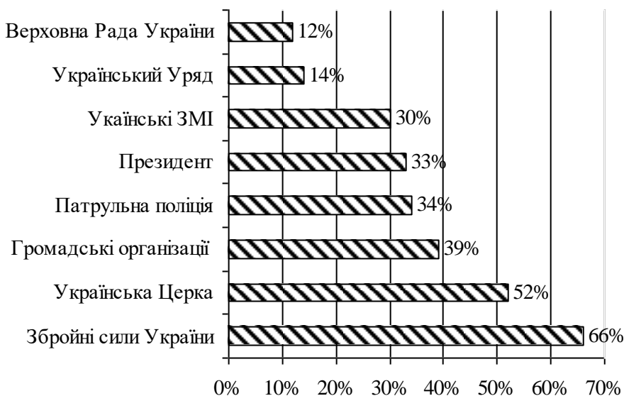
Рис. 2. Рівень довіри громадян України до владних інститутів, %

За показниками довіри до інститутів влади до початку війни в Україні, за даними соціологічної служби Центру Разумкова, наша держава займала останні місця серед країн Європейської спільноти, нижчі показники були лише в Греції (Довіра до інститутів, 2021).