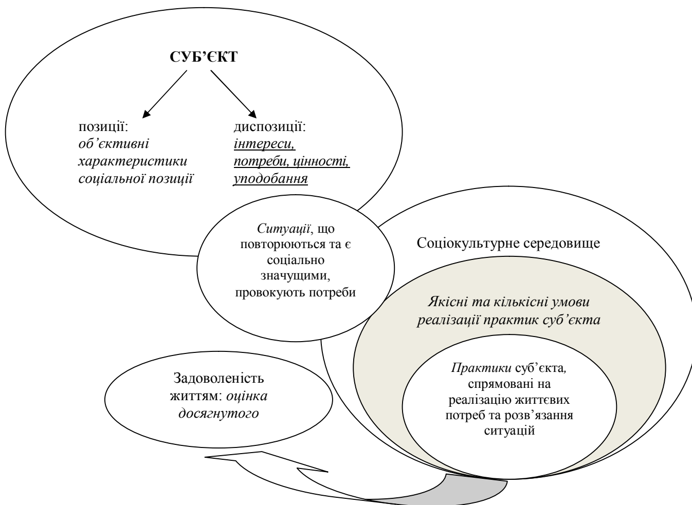
Рис. 2. Складники життєвої стратегії в умовах соціальної, культурної та психологічної проєкції індивіда на власне майбутнє

У структурі життєвих стратегій окремо слід виділити цінності й ціннісні орієнтації. Ціннісні преференції та їх ієрархія є домінуючим фактором при плануванні свого майбутнього й окремих соціальних практик, що, зі свого боку, пов'язані з наявними потребами індивіда, актуалізація яких приводить до вибору провідних життєвих цінностей.